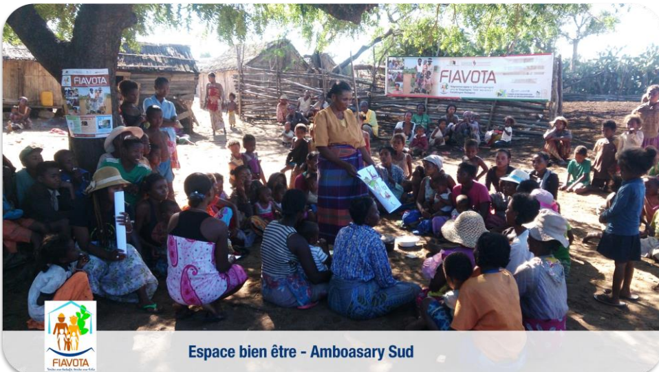
Espace bien être - Amboasary Sud